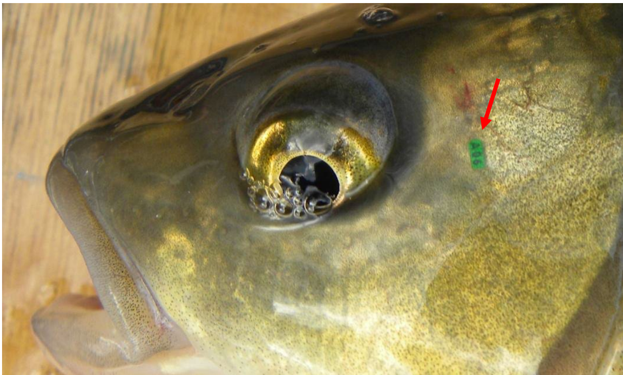
Abb.1.: Individuelle Markierung eines Aitels (Code: A06)

Die Lizenznehmer werden gebeten, gefangene Fische kurz zu kontrollieren und bei Vorhandensein einer visuellen Markierung den Code und soweit möglich auch den ungefähren Fangort in der Fischereilizenz einzutragen. Gefundene Transponder können an uns geschickt werden.